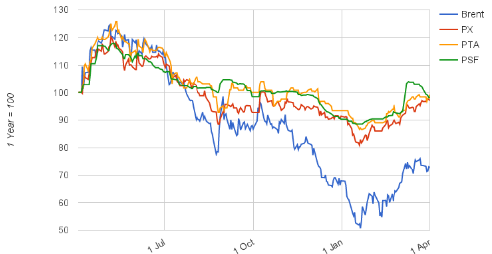
Biểu 2: Biến động giá trong chuỗi sản xuất polyester

Giá nguyên liệu từ cuối tháng 2, đầu tháng 3 tăng lên do giá dầu hồi phục và nhu cầu sợi trên toàn cầu. Sự tăng giá của nguyên vật liệu và giá bán sợi là như nhau trên giá trị tuyệt đối.